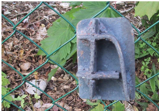
Photographie de la marque